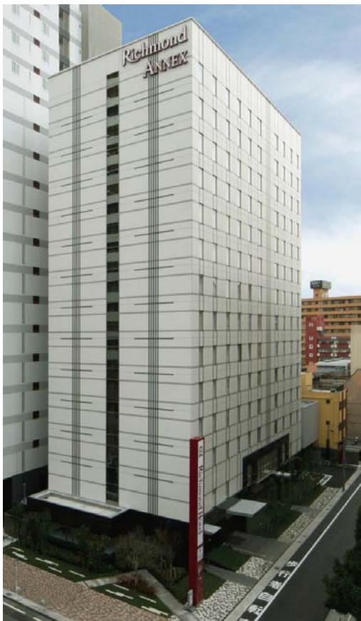
「宇都宮駅西口第四B地区再開発事業ホテル棟」

建築主：宇都宮駅西口第四B地区市街地再開発組合 設計：株式会社荒井設計、株式会社アール・アイ・エー 施工：大和小田急建設株式会社