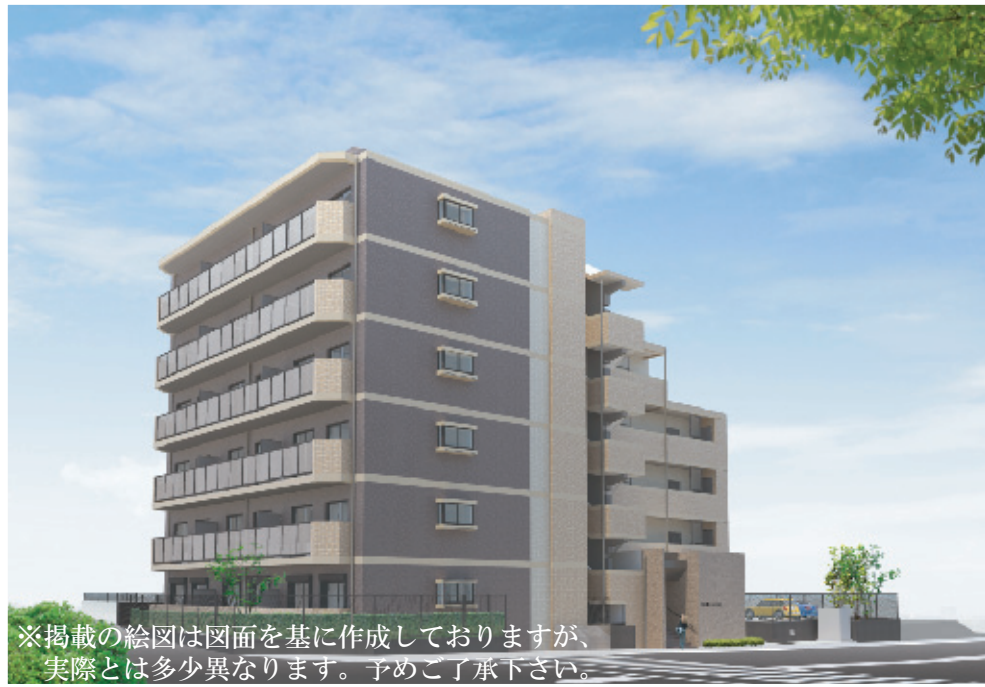
※掲載の絵図は図面を基に作成しておりますが、実際とは多少異なります。予めご了承下さい。