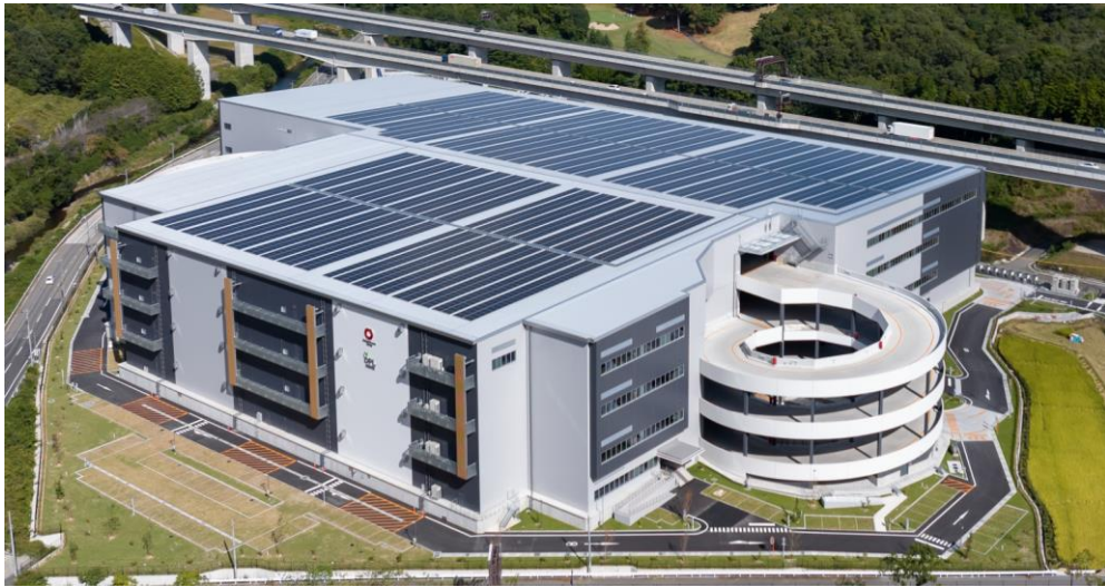
「DPL 兵庫川西」 外観

大和ハウス工業とフジタは、2022年2月より兵庫県川西市石道地区において、交通アクセスに優れ、免震システムを導入した大型マルチテナント型物流施設「DPL 兵庫川西」の開発を進めてきましたが、2023年10月13日に竣工しました。