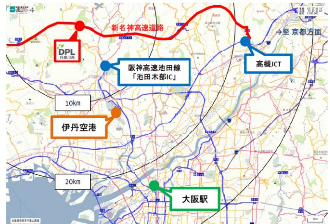
【DPL 兵庫川西 広域地図】