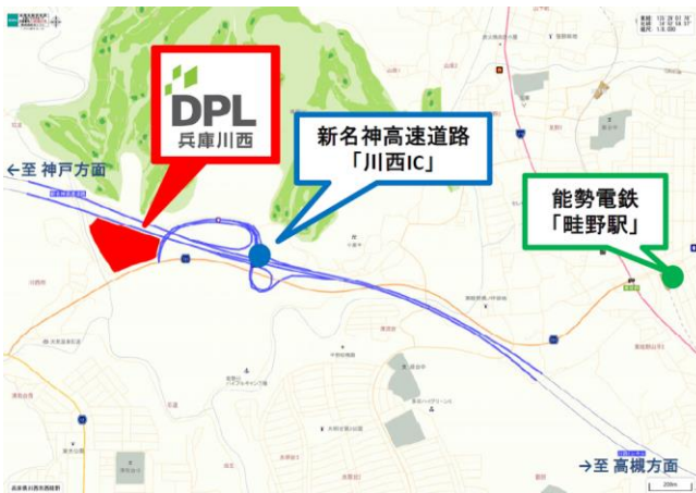
【DPL 兵庫川西 詳細地図】

「DPL 兵庫川西」は、新名神高速道路「川西インターチェンジ」から約800mと近畿エリアから中国・四国エリアまで短時間でアクセスできる場所に位置しています。加えて、能勢電鉄妙見線「畦野駅」から約3.3kmで、近隣には住宅団地「阪急北ネオポリス」をはじめとした大規模ニュータウンもあるなど職住近接の就労環境が整っています。