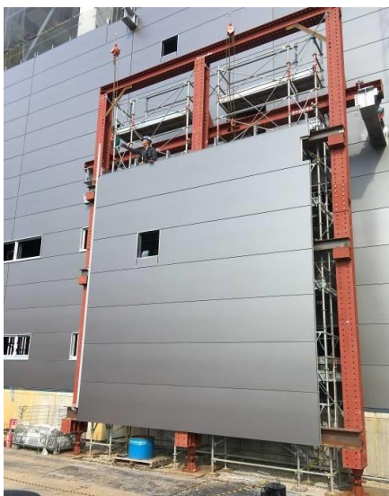
ユニットパネル製作設備