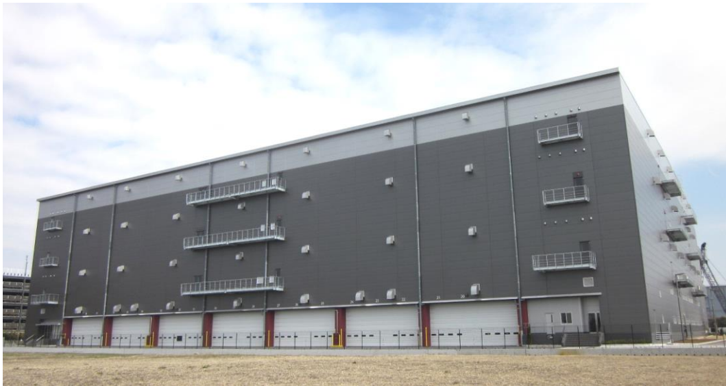
「(仮称) ノスキャップ工法」を使用した物流施設