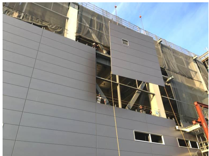
ユニットパネル取り付け状況