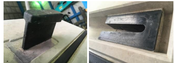
写真1 T型金物(左)、C型金物(右)